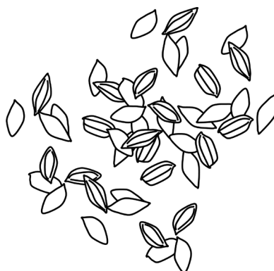
Illustration : ACK

Dans le cadre de l'Action Structurante du COSTEA au bénéfice du Réseau Ouest-Africain des Sociétés d'Aménagement et de Gestion de l'Irrigation (ROA-SAGI)